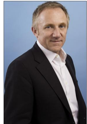
François-Henri Pinault Vorsitzender des Aufsichtsrats

Im abgelaufenen Geschäftsjahr 2010 konnte PUMA die Wirtschaftskrise erfolgreich überwinden und Umsatz und Profitabilität weiter stärken. Mit der Akquisition der Marke Cobra Golf wurde die Expansionsstrategie fortgesetzt und das Management präsentierte im Oktober einen neuen Fünf-Jahresplan mit ehrgeizigen Zielen.